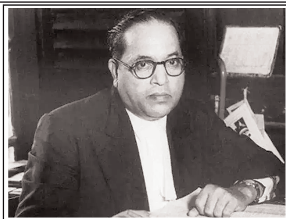
జీవించేందుకే మనిషి తినాలి

జనస్వరం న్యూస్ తెలుగు దినపత్రిక నందు తక్కువ ఖర్చుతో పుట్టినరోజు శుభాకాంక్షలతో పాటు అన్ని కార్యక్రమాలకు ప్రకటనలకు సంప్రదించండి. మా మెయిల్ ఐడి : janaswaramnews@gmail.com మొబైల్ నెంబర్ : 7013030690